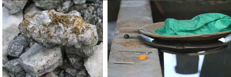
Mineros artesanales en Segovia usan cocos para la amalgamación de mineral en bruto.