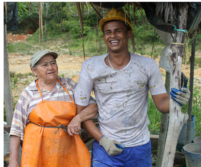
Mineros artesanales en la region de Segovia buscan maneras para mejorar la recuperacion de oro sin el uso de mercurio.